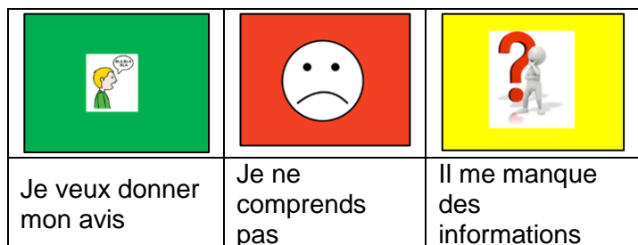
Figure 3 : Cartes de communication

Ensuite, des outils pour procéder à une décision de groupe par votation selon le principe de la majorité ont été proposés.