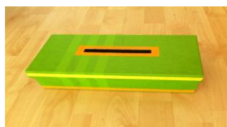
Figure 4 : Boîte de votation

Ensuite, des outils pour procéder à une décision de groupe par votation selon le principe de la majorité ont été proposés.