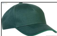
Figure 6 : Casquette du modérateur

Pour terminer, des symboles ont introduit les rôles du modérateur des échanges et du représentant du groupe de parole.