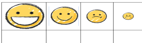
Figure 5 : Bulletin de votation

Pour terminer, des symboles ont introduit les rôles du modérateur des échanges et du représentant du groupe de parole.