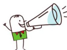
Figure 7 : badge du représentant