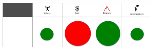
Figure 2 : Outil de pondération

Un deuxième outil, dit de pondération , propose une démarche pour élaborer des alternatives décisionnelles (les chemins), en évaluer les enjeux et permettre l'élaboration d'un choix (J'agis). Des fiches pour évaluer les attributs des alternatives (alliant la formulation écrite à des pictogrammes et du matériel plus manipulable) ainsi que des fiches aide-mémoire pour procéder à la pondération des ces attributs sont proposées.